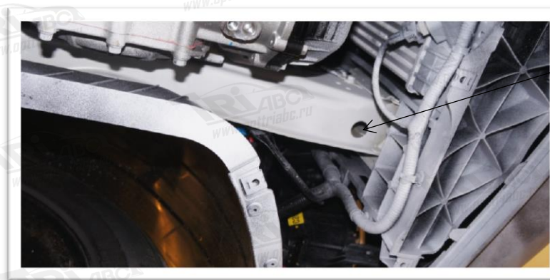
Место крепления кронштейнов

Для правильного позиционирования кронштейнов необходимо их прижать к бортику сбоку и спереди лонжерона.